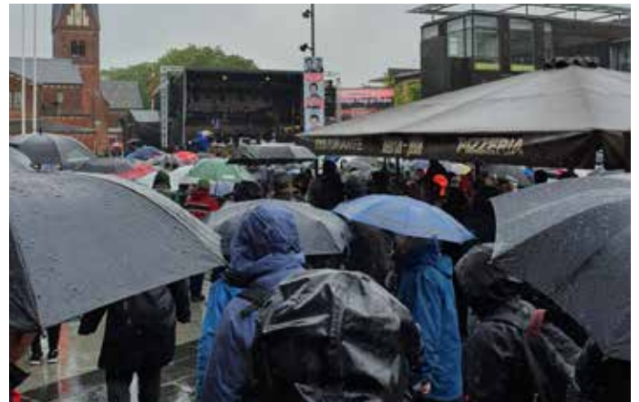
Åbningsgudstjenesten på Himmelske Dage i regnvej