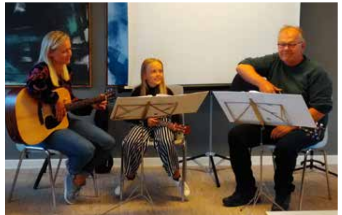
Helligsø musikskoles optræden ved borgermøde om sognesammenlægning