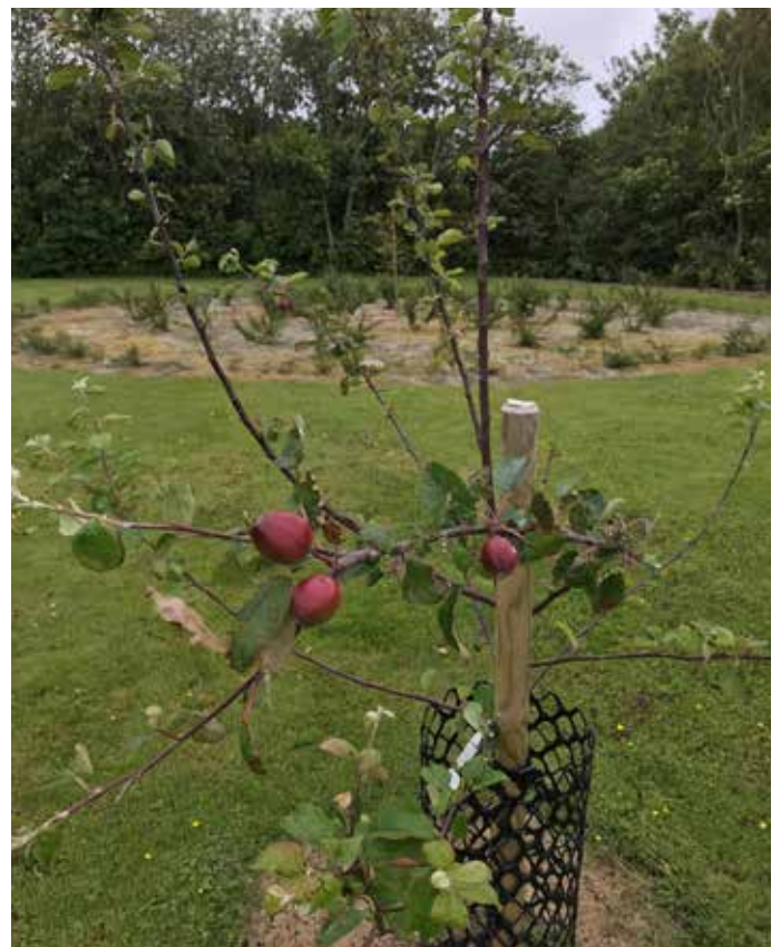
De første æbler på Gettrup kirkegård