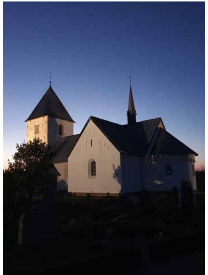
Smukke forårsaftener uden "fly-streger" på himlen