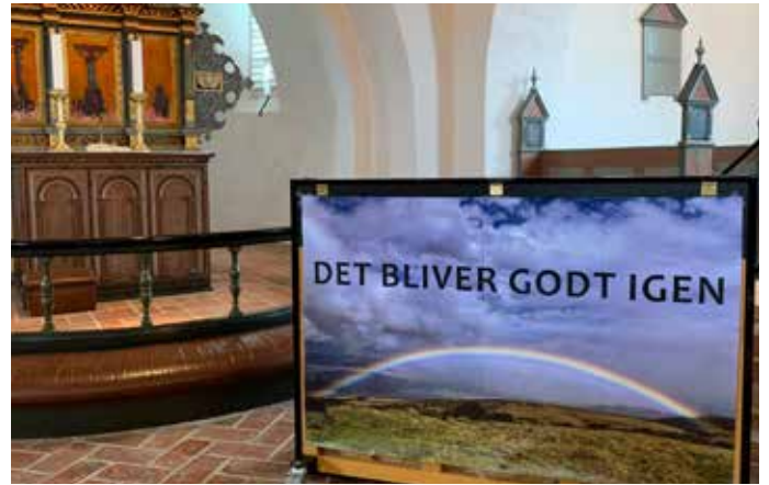
Klaveret dekoreret med "Det bliver godt igen"