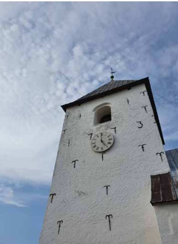
Kirkerne har fælles Corona-ringning kl. 17