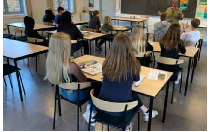
Konfirmander indvier de nye stole og borde i Kirkecentret