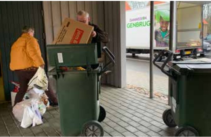
Lycestumper i store mængder afhentes af Danmission